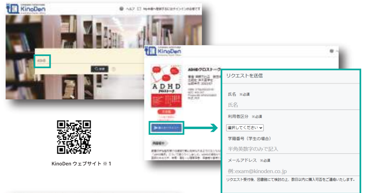
KinoDen ウェブサイト ※1

現在、丸善雄松堂の電子ブックサービス (Maruzen ebook Library) や紀伊國屋書店の電子ブックサービス KinoDen、ProQuest社のProQuest Ebook Centralから、購入リクエスト機能により附属図書館にリクエストできます。